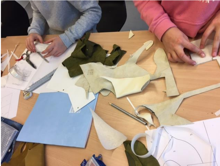
Nähprobe Lederpatchwork vorbereiten, nach Anleitung nähen